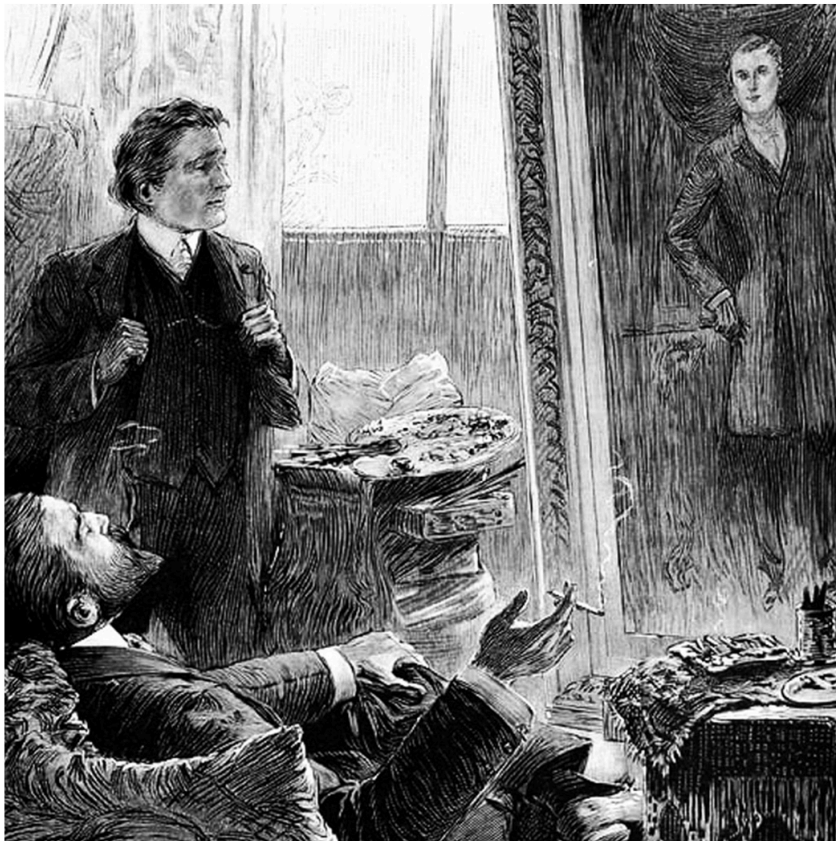
illustration Paul Thiriat

illustré par sept dessins de Paul Thiriat